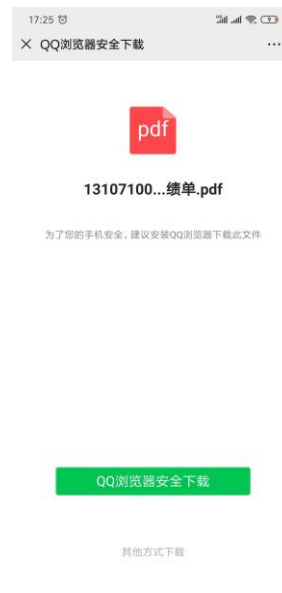
（图 3-下载 PDF 成绩单）